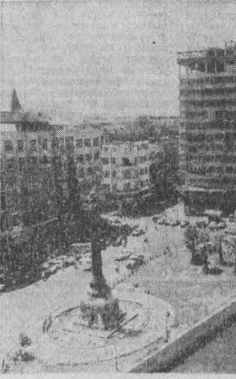
МНОГОЭТАЖНЫЕ дома, сочетающие в своем облике современность и национальные традиции, строятся в Дамаске, бурно развивающийся, быстро расширяющийся город. В этом ритме живет не только сирийская столица, но и вся страна. Город с многовековой историей приобретает новое лицо. И немалую роль в этом принадлежит молодому поколению сирийцев.

активно участвующему в осуществлении прогрессивных преобразований в стране и строительстве новой жизни. Ни одно из начинаний, будь то борьба с неграмотностью, строительство крупных промышленных предприятий или подъем сельского хозяйства, не обходится без участия молодежи. НА СНИМКЕ: в центре сирийской столицы.