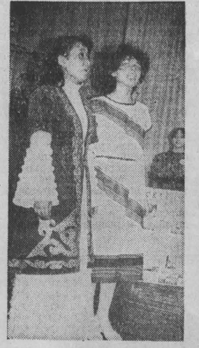
БОЛЬШАЯ работа по интернациональному воспитанию проводится в механико-технологическом техникуме. Здесь проводились встречи дружины народов СССР, членами которой учащимися зарубежных стран, которые здесь обучаются. НА СНИМКЕ: на фестивале дружбы народов СССР. Фото Г. Пичугина.

Самое горькое в этом деле то, что в беседе задержанные, подобно чеховскому герою из «Злоумышленника», смущения не проявляли и вину своей признать не хотели.