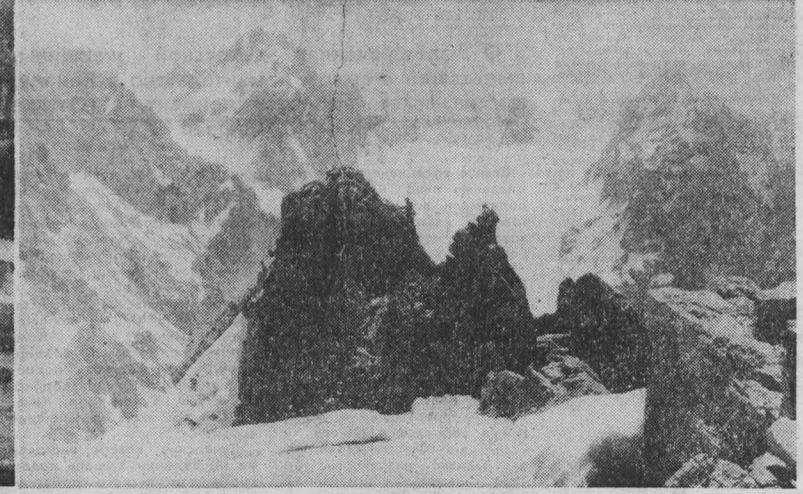
(Окончание. Начало на 1-й стр.)

Льготы установлены для фронтовиков только для проезда на городском пассажирском транспорте, где цена билета минимальная, не выше шести копеек, и автобусы имеют нумерацию маршрутов до ста. Что касается автобусов, идущих по маршрутам от 101 до 200-го, — здесь льготы не действуют, потому что цена билета гораздо выше минимальной.