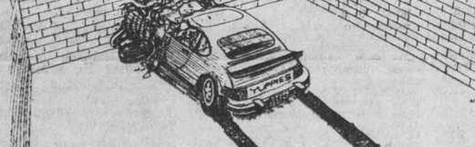
Одна из жертв биржевой лихорадки. Рис. из газеты «Нью-Йорк таймс». Фотохроника ТАСС.

«Вашингтон пост» публикует статью «Вспоминия Рейкьявика», в которой, в частности, говорится: «Встреча на высшем уровне в Исландии стала важным событием на пути к Договору о ликвидации ракет средней и меньшей дальности».