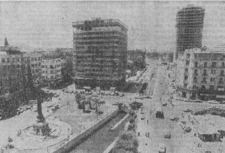
МНОГОЭТАЖНЫЕ дома, сочетающие в своем облике современность и национальные традиции, заставили путеводителей, леса новостроек в Сирии. Город с многовековой историей приобретает новое лицо. И немалую роль в этом принадлежит молодому поколению сирийцев.

Помимо установления равноправных отношений с Ираном, Советская Россия оказала поддержку самоотверженной борьбе афганского народа за национальное освобождение.