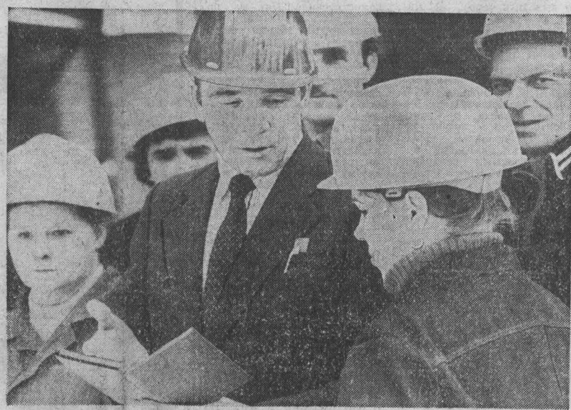
По итогам прошлого года коллектив Юргинского абразивного завода вышел победителем городского и областного социалистического соревнования. Высочайше областного победителя удостоился завод № 31, который ручной трудом добился здесь смена плановых показателей — 70 ударных недель, смена решила выполнить и этой дате план девяти лет пятилетия.

Год большинство коллективов домостроителей Кузбасса начали непохоже. Надо выдерживать и развить этот темп.