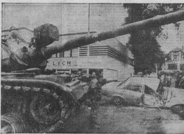
МИЛИТАРИСТСКИЕ ИГРИЩА, устраиваемые на западногерманской территории в рамках осуществления Вашингтонского и НАТО курса на озвучивание гонимых вооружений...