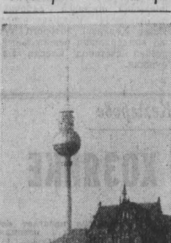
В этом году столица ГДР отмечает 750-летие со времени основания. Выдадут почтовые марки. НА СНИМКЕ: силуэты Берлина. Фотохроника ТАСС.