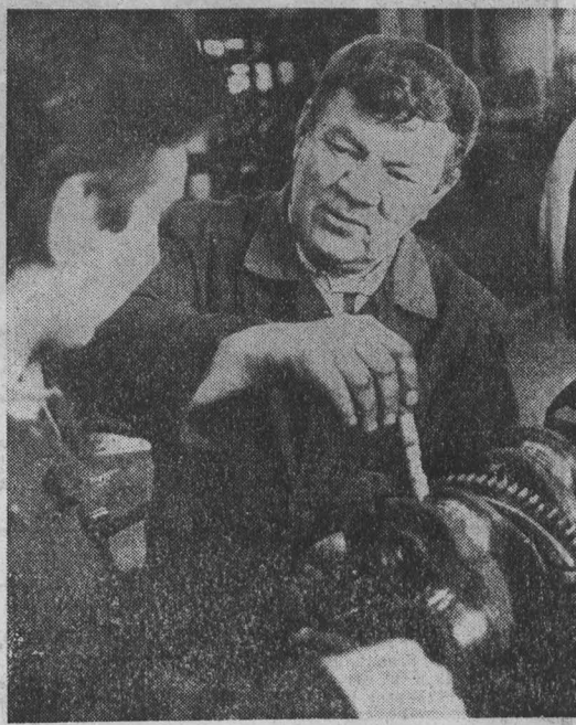
Ремонтно-техническое предприятие, расположенное в селе Красном можно отнести к разряду местных достопримечательностей. Оно выросло на базе МТС, где более полувека назад обустраивались первые отечественные тракторы, комбайны «Коммунар», а также знаменитые «Фордзоны» и «Форды». Нелегко приходилось тогда специалистам и солдским умельцам, тнуившимся и технике, материально-технической базой, в том числе, в так называемые «Фордзоны» и «Форды». Нелегко приходилось тогда специалистам и солдским умельцам, тнуившимся и технике, материально-технической базой, в том числе, в так называемые «Фордзоны» и «Форды».