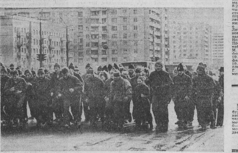
Второй этап акции «Мир — миру!».

Редактор А. В. ТРУТНЕВ. НАШ АДРЕС: 605630, ГСП, г. Кемерово, проспект Октябрьский, 28. ТЕЛЕФОНЫ: для справок — 52 32-74, справки по письмам — 52-03-22. Адрес издательства «Кузбасс»: 605630 ГСП г. Кемерово, проспект Октябрьский, 28. Газета выходит 300 раз в году. Тираж 260 тыс. экз. Объем 2 п. л. ИНДЕКС 51901 ОП 03990. Заказ № 248. 1 2 3 4 5 6