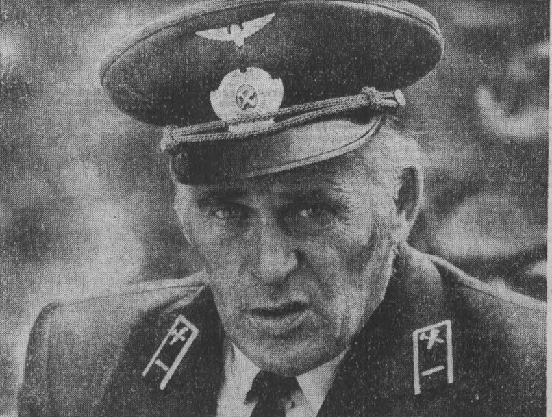
Всего год назад коллектив пассажирской колонии дономотивного депо Гомни при подведении окончательного результата работы стал применять коэффициент трудового участия. Эта форма незамедлительно дала свои положительные результаты. Резко повысилась трудовая дисциплина, не стало брака в работе, чистота машинистов повысилась.

Бюро обкома КПСС, исполком областного Совета народных депутатов, президиум областного совета профессиональных союзов и бюро обкома ВЛКСМ утвердили условия областного социалистического соревнования за успешное проведение зимовки скота, увеличение производства и закупок молока в зимний период 1987-1988 года.