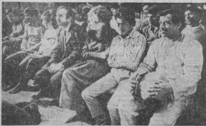
мы — интернационалисты

Продолжается фестиваль Индии в Советском Союзе. В рамках этого грандиозного мероприятия завтра в помещении Государственной филармонии Кузбасса состоится выступление большой фольклорной группы из дружественной страны. Это будет началом ее гастролей в Кемеровской области