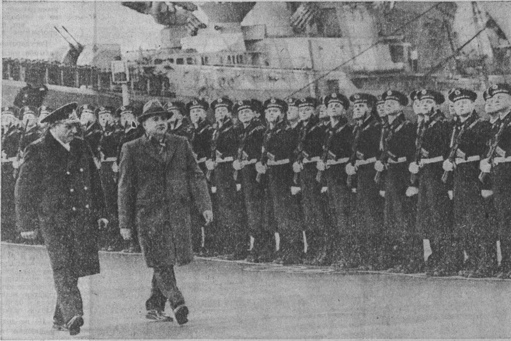
Генеральный секретарь ЦК КПСС М. С. Горбачев во время посещения крейсера «Киров».

С одной стороны, продолжал М. С. Горбачев, в результате низких цен на основные продукты питания, которые сохраняются в течение 20—30 лет, ослабла уважительность к главному продукту — продовольствию. Подумайте: то, что является источником жизни, потеряло свой престиж. А ведь веками на земле была проблема — заработать на кусок хлеба. С другой стороны, надо помнить, что решать вопрос о поднятнн престижа продук-