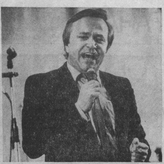
Праздник музыки, праздник радостных встреч с творчеством композиторов и исполнителей шагает по земле Кузнецкой. В концертных залах, домах и дворцах культуры области с успехом проходят концерты, на промышленных предприятиях и в учебных заведениях — творческие встречи кузбассовцев с участниками фестиваля советской музыки.