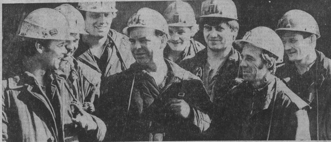
Не снижают высоких темпов добычи горняки шахты имени Волкова объединения «Северкузбассуголь». Еще в августе этот коллектив выполнил план двух лет вынужденной палитки, а сегодня успешно работает по досрочному выполненному заданию года. За восемь месяцев шахтеры выдали на-гора 120 тысяч тонн

— Ведь живое производство, — показывает он его помещения. — Стались совсем пустыми, монтаж нового оборудования, бла