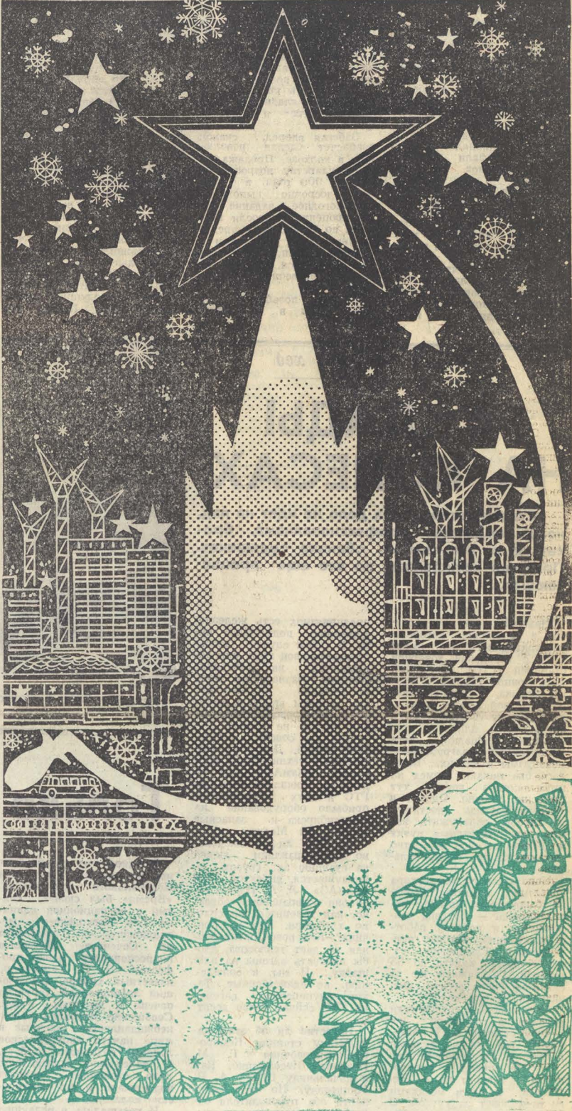
Плакаты худ. В. Иандеева.