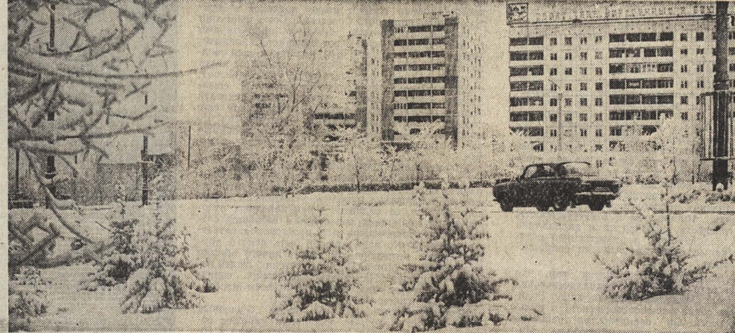
Кемерово. Город в снежном серебре.