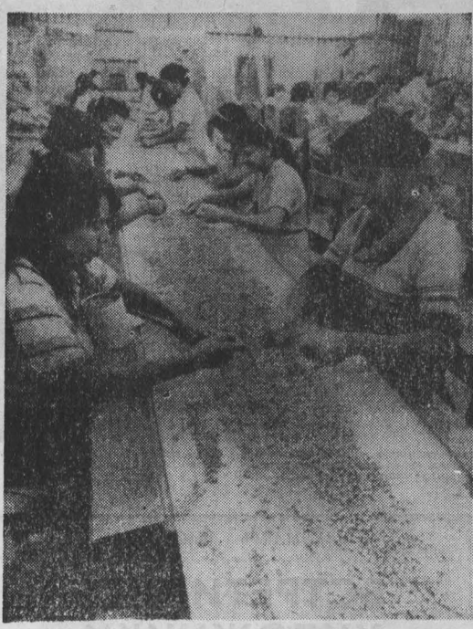
Кофе — главная экспортная культура и важнейший источник валютных поступлений Республики Никарагуа...