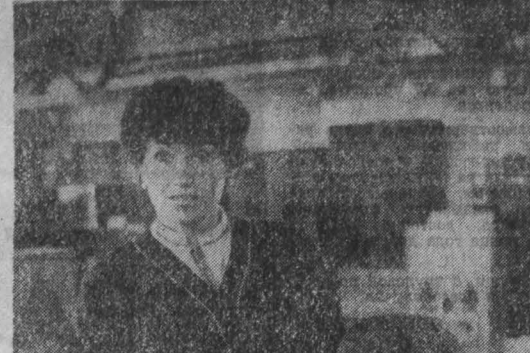
г. Прокопьевск.