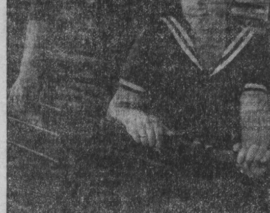
человек и природа