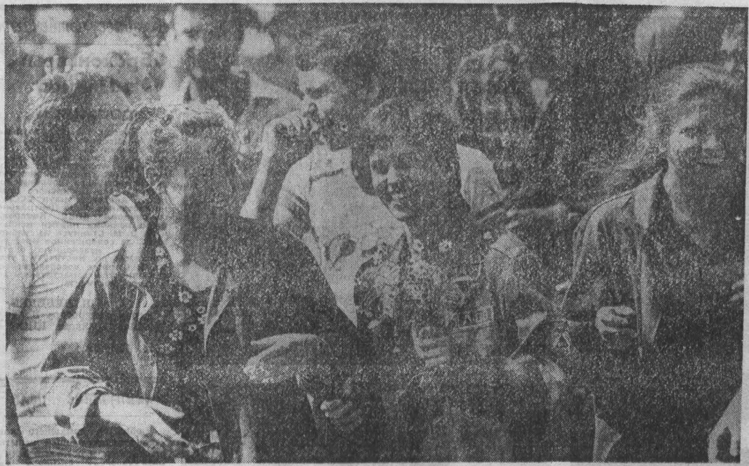
Г. Кемерово.

НА СНИМКЕ: студенты из Лейпцигского университета в бойцах отряда «Товарищ».