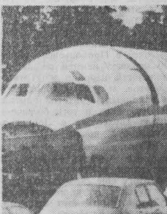
ИСПАНИЯ. Самолет... среди автомобилей — такое необычное соседство можно было наблюдать недавно на одном из шоссе в Мадриде...