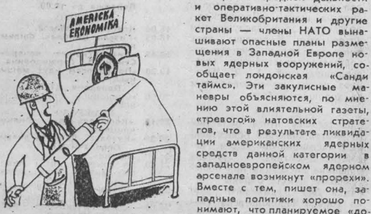
Американская экономика. — Попробем сделать еще одну инъекцию СОИ («Рогат», СССР).