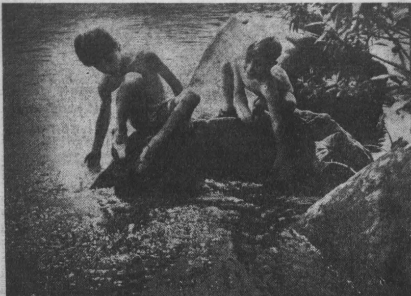
фотоконкурс - Земля Кузнецкая

16.00 «Новости Кузбасса». 18.05 «Коллекция». Фильм-концерт. 18.40 «Литературные вечера». Басис. 19.35 «По дороге идут машины». Передача ЦТ. 20.00 «Спокойной ночи, малыши». КЕМЕРОВО. 20.15 «Коллекция». Фильм-концерт. 20.30 «Кузбасс. День за днем». Передача ЦТ. 21.00 «Время». 21.40 Из сокровищницы мировой музыкальной культуры. 22.40 «Речна-невеличка». Документальный телефильм. 23.00 «23.00. Голубиный остров». Мелодия. III ПРОГРАММА Передача ЦТ. 18.05 «Новости». 18.45 «Коллекция». Тележурнал. 19.15 Ритмическая гимнастика. 19.45 «Коллекция». Весокожные соревнования. 20.00 «Спокойной ночи, малыши». 20.15 «Это вы можете». 21.00-21.35 «Время».