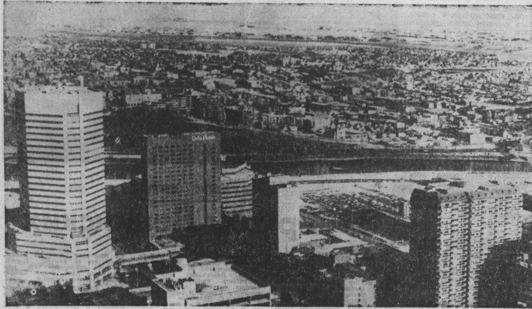
В КАНАДСКОМ городе Калгари в 1988 году пройдут соревнования XV зимних Олимпийских игр. Это город с 600-тысячным населением в провинции Альберта на западе страны. НА СНИМКЕ: вид на Калгари.

Мы были свидетелями многих событий. Мы родились в период первой мировой войны и Октябрьской революции. Мы пережили безумные двадцатые годы, кризис, депрессию тридцатых, подъем фашизма. Затем мировая война, и во время войны — изобретение и первое применение атомной бомбы. Потом годы напряженности, «холодной войны», а затем — человек в космосе. Теперь мы стоим на той грани, за которой у человечества есть только один выбор — жизнь или смерть.