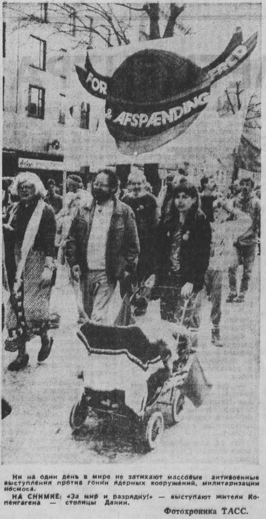
Ни на один день в мире не затихают массовые антивоенные выступления против гонимых ядерных вооружений, милитаризации космоса.

Печать социалистических стран подробно освещает дружескую встречу Генерального секретаря ЦК КПСС М. С. Горбачева с выдающимся латиноамериканским писателем Габриэлем Гарсиа Маркесом.