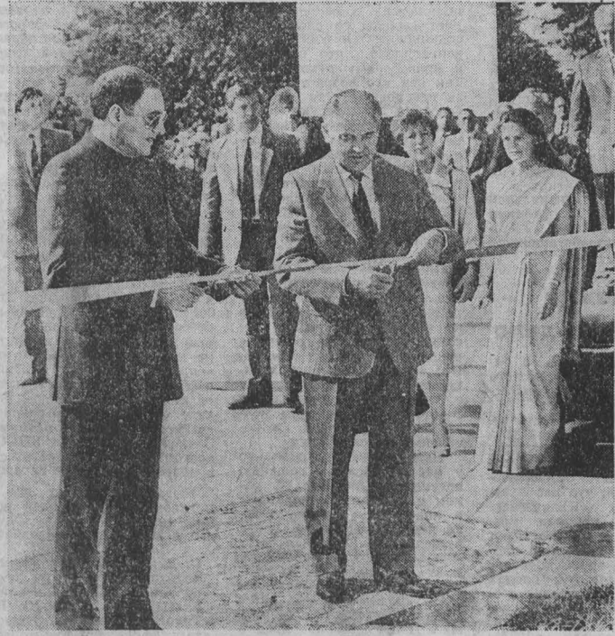
Во время церемонии открытия памятника.