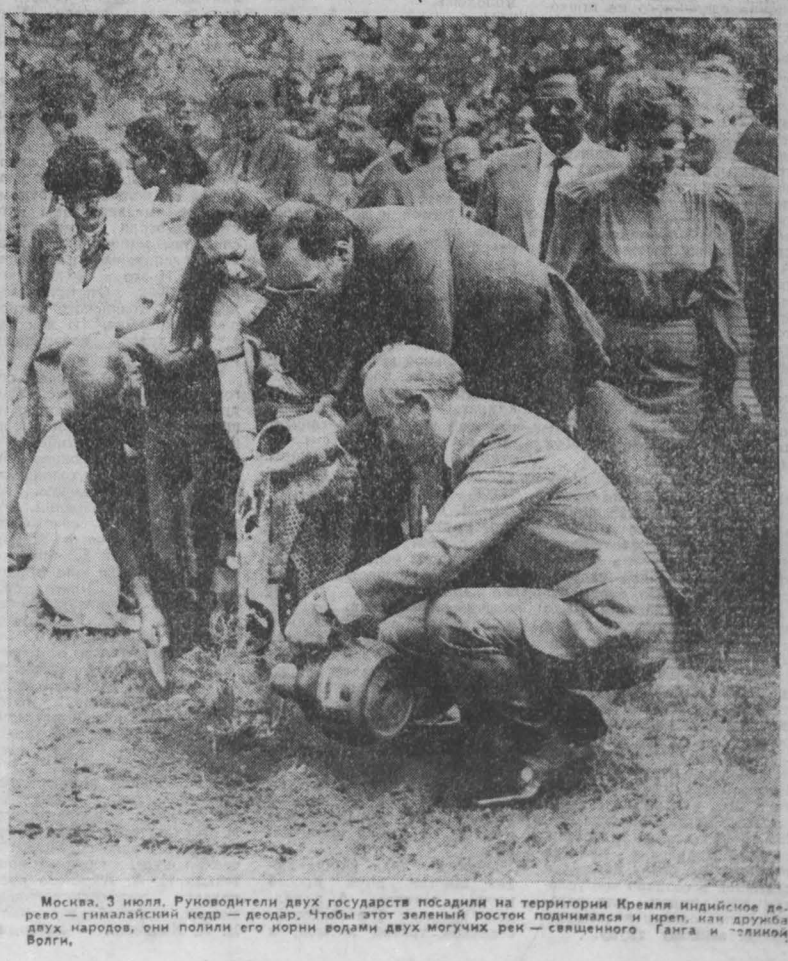
Москва, 3 июля. Руководители двух государств посадили на территории Кремля индийское дерево — гималайский кедр — деодар. Чтобы этот зеленый росток поднимался и рос, как дружба двух народов, они полили его корни водами двух могучих рек — священного Ганга и «слизкой Волги».

Торжество на Соборной площади завершается ярким, праздничным танцем, славящим землю и людей, природу и Вселенную, славящим мир — мечту всех людей доброй воли.