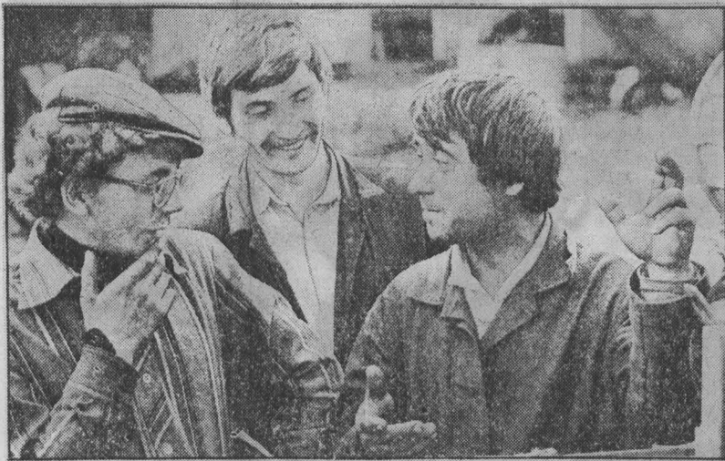
Первыми в районе начали сдачу витаминных гранул специалисты совхоза «Тисульский». Полный сатовый день трудятся механизаторы хозяйства, скармливая зеленую массу для АВМ-1.5. Сто пятьдесят тонн ценного корма уже сданы государству. А всего за

Травы нынче созревают раньше обычных сроков, и чтобы не потерять в качестве, надо без раскачки выводить на луга косилки. Ключевая цель — заготовить кормов больше и с хорошим качеством — ясна каждому полеводу. Дело за организацией труда, за умением партийных организаций колхозов и совхозов найти точку приложения сил для каждого коммуниста, каждого рабочего и специалиста хозяйства. Лозунг «О кормах, как о хлебе» становится важнейшей необходимостью.