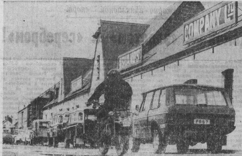
фотоатлас Мальвинские (Фолклендские) острова

Нарастающие народные выступления против южнокорейского режима Чон Ду Хван вызывают озабоченность во всем мире, признает политический обозреватель «Нью-Йорк таймс», который отмечает, что критическая ситуация на юге Корейского полуострова угрожает проведению в Сеуле Олимпийских игр.