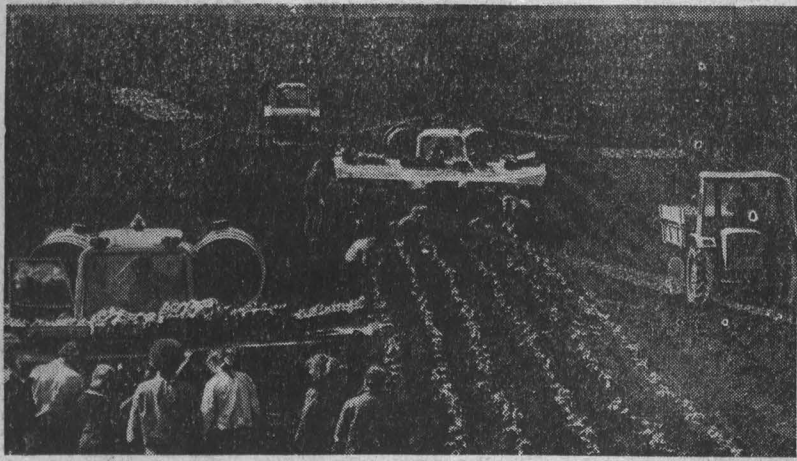
Весенние заботы агропрома

Орган Кемеровского обкома КПСС и областного Совета народных депутатов