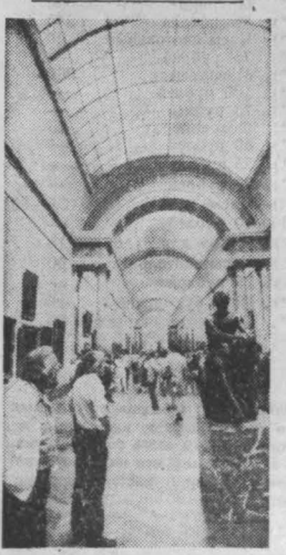
Париж. Один из крупнейших музеев мира Лувр прокладывает выходящими произведениями многих стран и народов. Поэтому его залы всегда заполнены любителями изобразительного искусства.