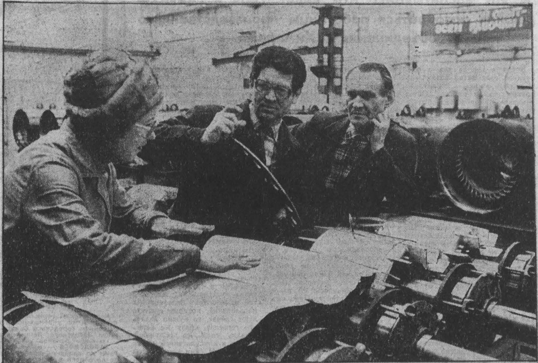
Со многими проблемами столкнулся коллектив объединения «Кузбассэлектромотор», когда их продукция стала приниматься представителями государственной приемки. Немало разобраной продукции сегодня возвращается на конвейеры, вновь разбирается, доводится до тех параметров, которые предусмотрены стандартом. А на это вновь требуется время, затраты сил и электроэнергии.

С первых дней года надо без расщелин добиваться четкой работы всех звеньев народного хозяйства. Следует умело направлять деятельность финансовых, банковских органов, работников бухгалтерского учета и финансовых служб предприятий, повысить их инициативный труд. Важно наладить повседневный контроль рублем за результатами хозяйствования. Это станет заметным вкладом финансистов в переводе экономики области на рельсы интенсификации.