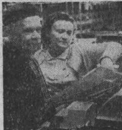
НОВОСИБИРСК. В стадии проекта устранить многие проблемы будущей большой стройки позволяет маневренный метод проектирования...

В безалкогольном ресторане «Заря» состоялась встреча членов клубов «Товарищи» и «Материнская слава».