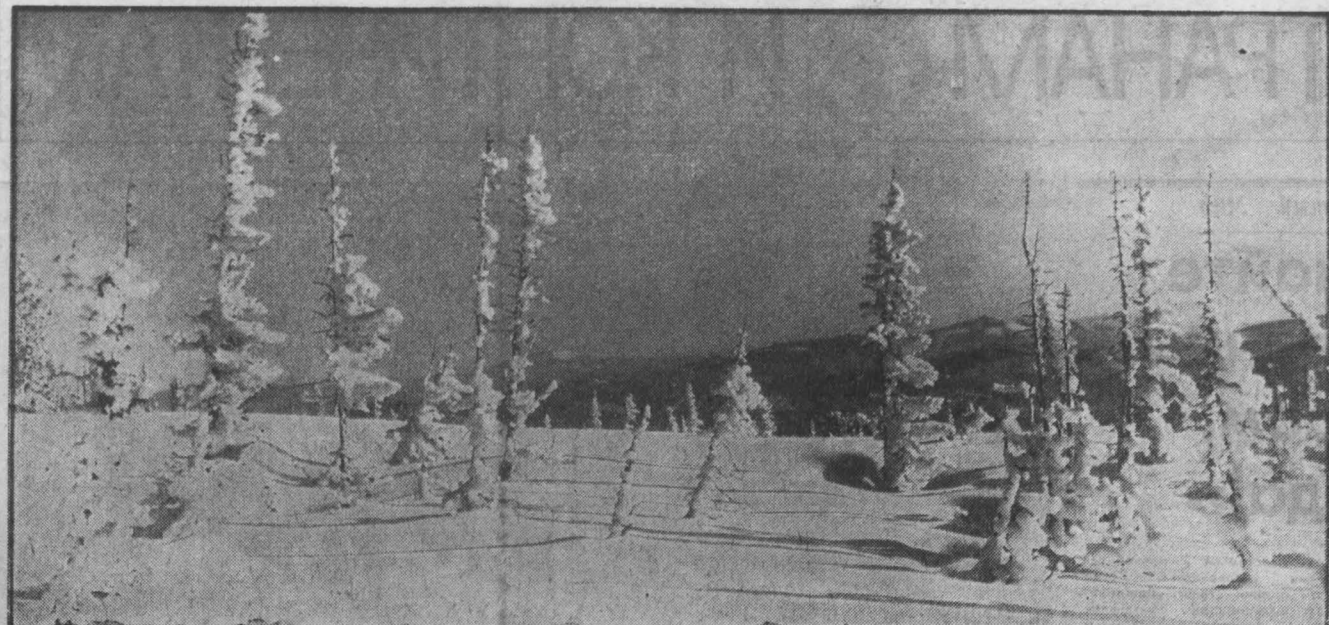
Фотоконкурс «Земля Кузнецкая»

Обкатываются лыжники, отработавшие методы и способы учета пройденных километров. Открываются новые пункты проката, которые пополнились тремя сотнями пар новых лыж.