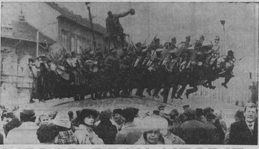
Будапешт. Скульптурная группа работы известного венгерского ваятеля Имре Варги установлена на столичной площади Вермезе. Это памятник Беле Куну — видному деятелю международного коммунистического и рабочего движения, одному из организаторов и руководителей Компартии Венгрии, открытой в честь столетия со дня его рождения.

«Самая рентабельная, самая дешевая и самая лучшая форма обороны Соединенных Штатов — это раз-