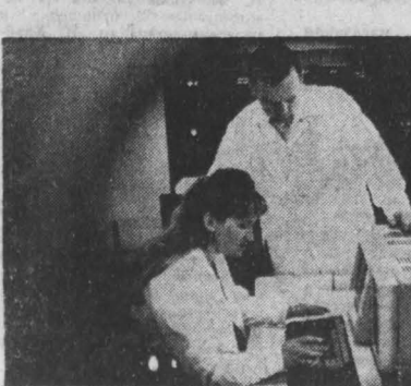
САРАТОВСКАЯ ОБЛАСТЬ. На ускоренные методы создания новых сортов и гибридов пшеницы решила селекционная бригада Поволья. Сейчас готовится к передаче на промышленные испытания новая линия известной пшеницы «сaratovskaya-42».

АЛДАН (Иркутская АССР), 13. Энергия Нерюнгинской ГРЭС начала поступать на объекты Алданского промышленного узла по 250-километровой ЛЭП-220. Линия электропередачи проложена через горы, непроходимую тайгу, вдали от будущей трассы строящейся железной дороги Берикант — Томанот. Алданск. С вводом нового энергозаста отпала необходимость в мелких передвижных электростанциях.