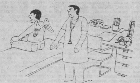
Снабженец на приеме у врача: — Как этим крыльям не вырасти, если приходится летать за дефицитом по всей стране.