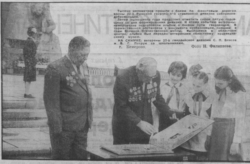
Тысячи километров прошли с боями по фронтовым дорогам войны 22-й Фронтальной стрелковой дивизии сибиряков-добровольцев. Летом нынешнего года предостоят отметить сорол пятую годовщину со дня формирования дивизии. И этому событию ветераны немерзаче подготовили альбом о боевом пути гвардейцев. В торжественной обстановке у монумента кузбассовцам, павшим в годы Великой Отечественной войны, высвещен в областном центре альбом перед ветеранами областного государственного музея.

*) «Своими глазами». Мы — интернационалисты. Ред. сост. Б. Сивянский, художник В. Илландев. Кемеровское кн. изд-во, 1987.