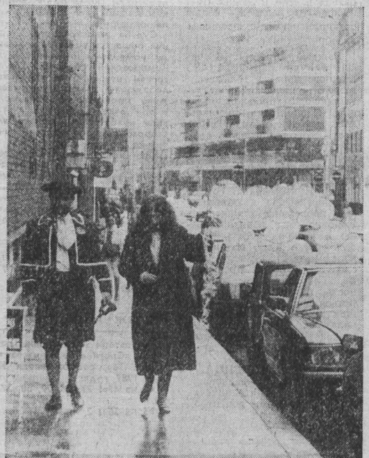
(ТАСС, 19 мая).