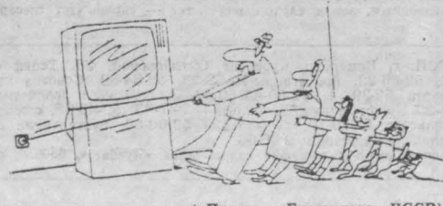
(«Правда», Братислава, ЧССР).