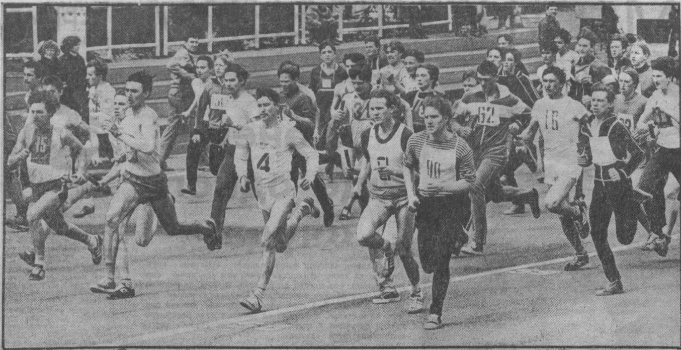
на приз газеты «Кузбасс»