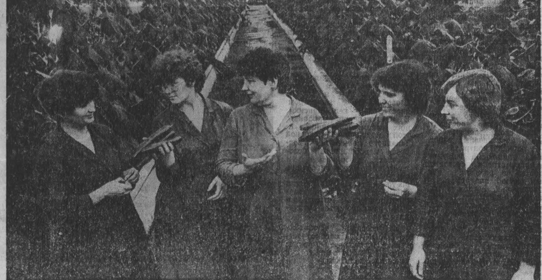
ЧЕТЫРЕ малолетних конвейера — так можно характеризовать работу тружеников небольшого, но крайне нужного производственного цеха Ленинского цементного завода. Созданное четыре года назад, оно помогает рабочим и служащим своей продукции круглый год выдать свежие овощи в ассортименте хозяйства — перец, лук, помидоры, огурцы. В первую очередь свежими овощами снабжаются детские учреждения, г. Топки.

Много сейчас говорим и пишем о том, что товары надо выпускать не для призрака, а нужные людям. Исход из этих соображений, не возьмется ли кто за выпуск инструмента для чистки рыбы? З. МЕШАНОВА, г. Ленинск-Кузнецкий.