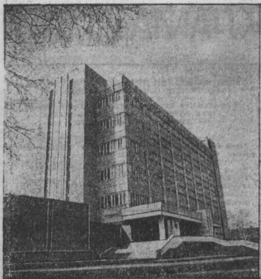
сегодня — День радио