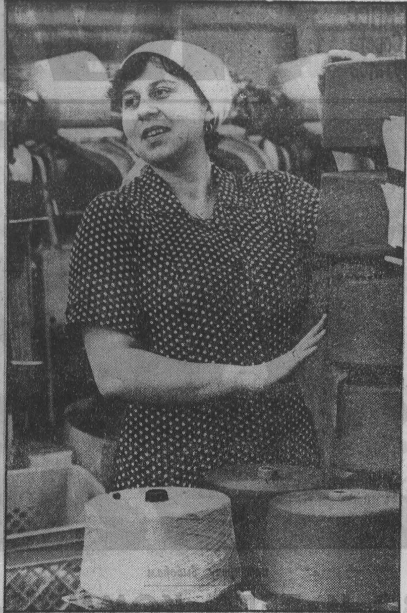
В честь 70-летия Октября