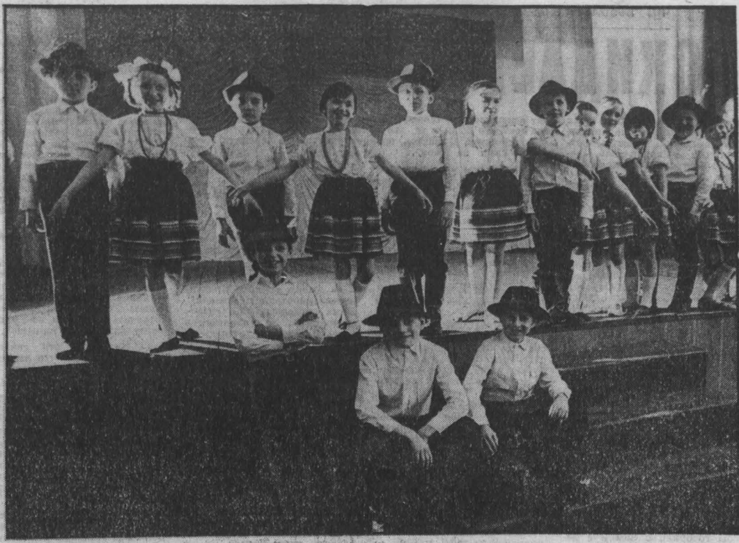
Танцевальный коллектив младшей группы Дворца пионеров имени Зои Космодемьянской (это вы видите на сцене) организованы всего два года назад. Заниматься сюда приходят в основном второклассники. Несмотря на маленький возраст, самодеятельные артисты уже имеют в своем репертуаре сложные современные танцы. В дни зимних и весенних каникул, на праздничных утренниках они выступают на сцене школ города. г. Киселевск.