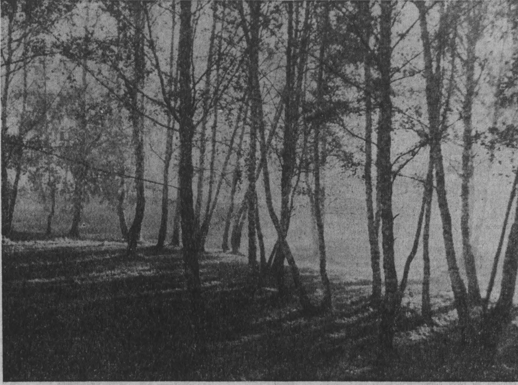
БЕРЕЗЫ. г. Кемерово.