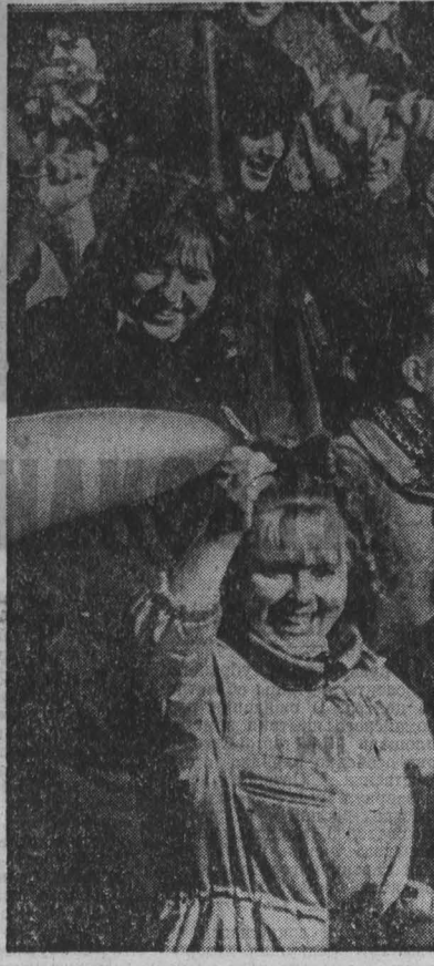
Праздничная демонстрация в Кемерове.