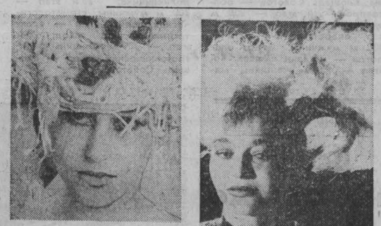
США. Как известно, головной убор — одна из важнейших деталей женского туалета, и представительницы прекрасного пола стремятся точнее его выразить. Иди навстречу модницам, художникам и дизайнерам пытаются создавать оригинальные шляпы не только по