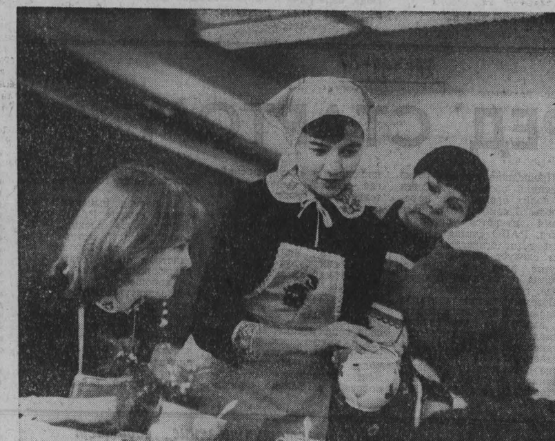
Знай и умеи

Сколько событий произошло в доме молодых специалистов горжилуправления, что расположено по проспекту Ленина, 137а!