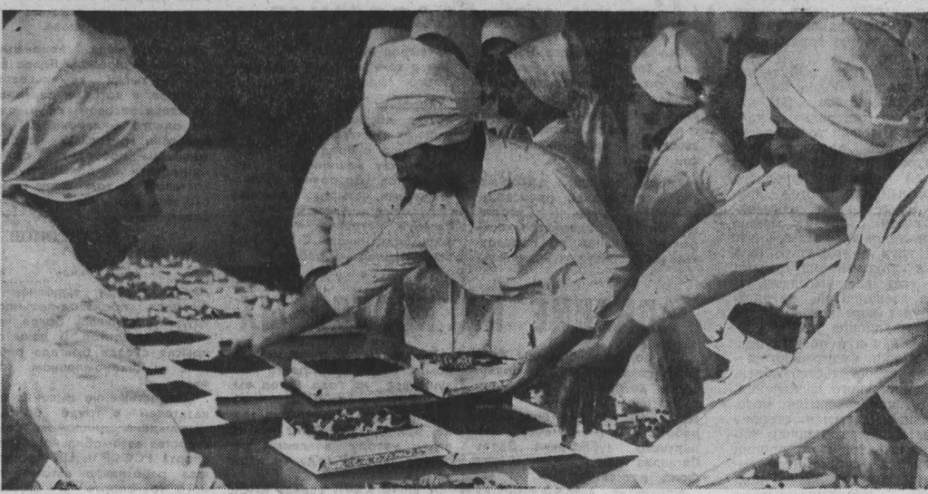
В Новокузнецке, на хлебокомбинате № 2, прошел смотр-конкурс кондитеров областного управления хлебопекарной и макаронной промышленности. Цель конкурса — повышение профессионального мастерства, изучение и обобщение передовых методов и приемов труда, улучшение качества выпускаемой продукции.

В партию объединили «Химволокно» — задумались над этим, решили провести, какова роль депутатов-коммунистов в трудовом коллективе. Общились производством. И что же выяснили? Есть барьер между депутатами-работниками и управленческим аппаратом. Это одно. И второе. Сами депутаты не рассказывают о решениях сессий, не отчитываются перед товарищами.