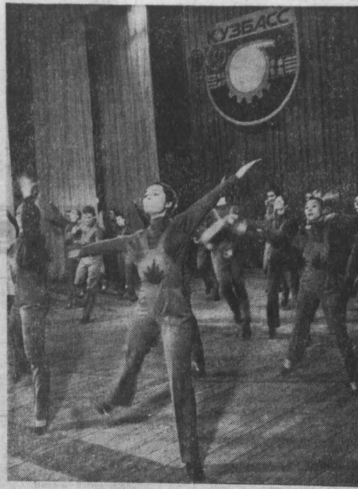
ПРИМ праздником самодельного художественного творчества стал традиционный конкурс хореографических коллективов области. На сцене театра оперетты Кузбасса демонстрировали свое искусство ансамбли дворцов и домов культуры, учебных заведений. Зрители восторженно принимали танцы народов мира, хореографические композиции, шутливые миниатюры.

Этим праздничным концертом хореограф и самодельный артист-исполнитель заявили о том, что они в отличной творческой форме встретили второй Всесоюзный фестиваль народного творчества.