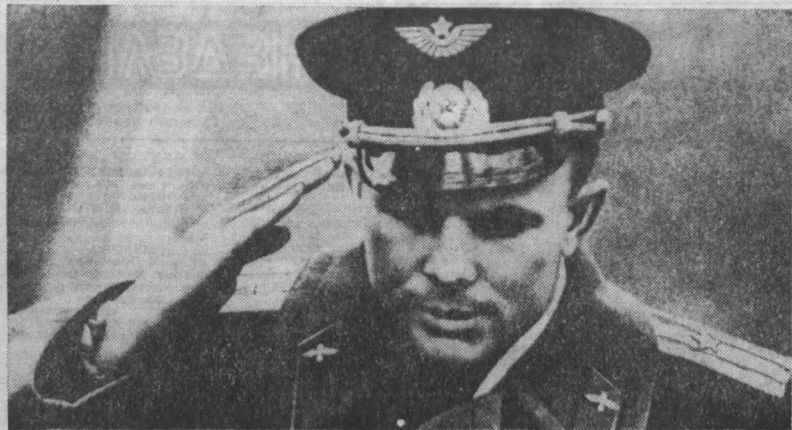
МОСКВА, 14 апреля 1961 года. Торжественная встреча на Внуковском аэродроме Юрия Алексеевича Гагарина. НА СНИМКЕ: Ю. А. Гагарин докладывает об успешном выполнении задания.