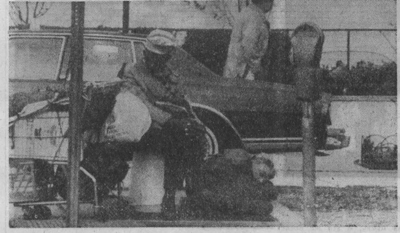
США. Для этих людей, отверженных обществ «равных возможностей», единственным пристанищем стала улица. По данным общенациональной переписи населения в США в 1980 году...