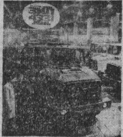
БОЛЬШЕ и ответственнее задачи стоят перед коллективом ЗИЛ в новой девятицилиндровой пятилетке. Предстоит провести реконструкцию предприятия и перейти на выпуск новых более экономичных грузовых автомобилей ЗИЛ-4331 с дизельным двигателем. НА СНИМКЕ: на участке сборки новых перспективных грузовых автомобилей ЗИЛ-4331 с дизельным двигателем в автосборочном корпусе.