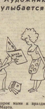
Подарок маме к празднику 8 Марта.