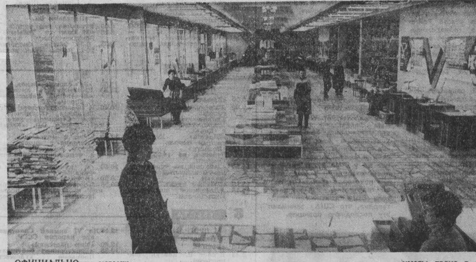
ОФИЦИАЛЬНО магазин «Юный техник» должен быть открыт 5 февраля. Объявлен об этом событии заготовка, сделана не было, в залах еще шла подготовка, но мальчишки уже несколько дней лепили к витринам, а некоторые даже удавалось проникнуть вовнутрь. Вместе с продавцами и столярами они что-то мастерили.

А тут, в новом «Юном техник», торговые залы площадью 900 квадратных метров. Впечатляет! Отдельные