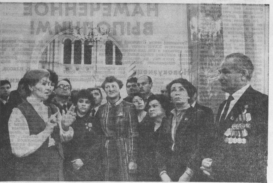
НА СНИМКЕ: делегаты XXVII съезда КПСС от Кемеровской областной партийной организации в Георгиевском зале Большого Кремлевского дворца.