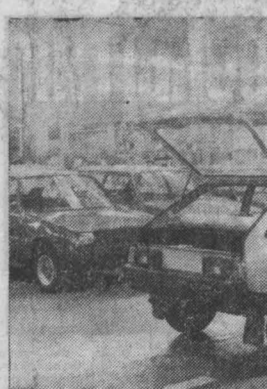
УКРАИНСКАЯ ССР. Коллектив автозавода «Коммунар» головного предприятия производственного объединения «АвтоЗАЗ» — обласил выпускать опытный прототип автомобиля «ЗАЗ-1102» и отпробировать его на трассе.

Мы говорили об уникальности музея в Юрге. Но у него уже появились последователи, которые вполне могут стать его соперниками, если наш музей останется в своем развитии и углубит сферу деятельности. Как стабильно, подобное учреждение собирается открыться в Новосибирске, омичи приезжали в наш город пережить опыт. Есть вполне резонные опасения, что со временем нам придется отягачиваться до уровня постановки дела в этих городах. Разумеется, пусть таких музеев становится все больше и в Сибири, и во всей стране. Обидно упустить новые возможности настоящей, углубленной работы с детьми.