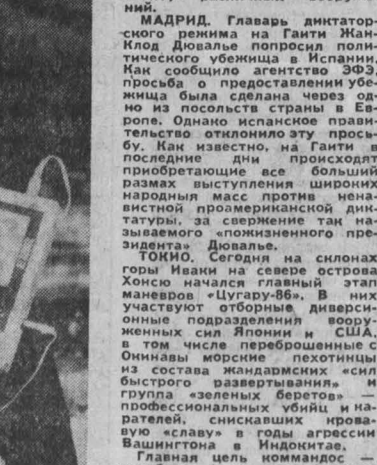
Япония. Более чем на три с половиной тысячи метров над уровнем моря взметнулись клубы белого дыма над ипподромом в Иводзима, расположенного в 1300 километрах к югу от столицы Японии.