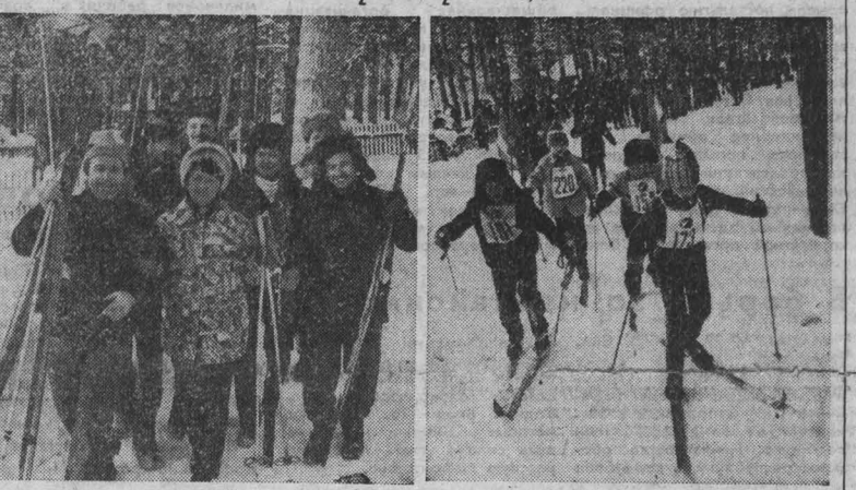
Зовет лыжня здоровья