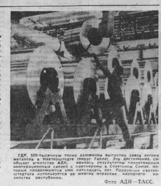
ГДР, 500-тысячную тонну алюминия выпустил завод легкого металла в Нахтерштедте (округ Галле). Это достижение, сообщает агентство АНД, является результатом плодотворных кооперационных связей с партнерами в Советском Союзе, которые продолжают уже пятнадцатый лет. Продукция нахтерштедтцев используется во многих отраслях народного хозяйства республики.