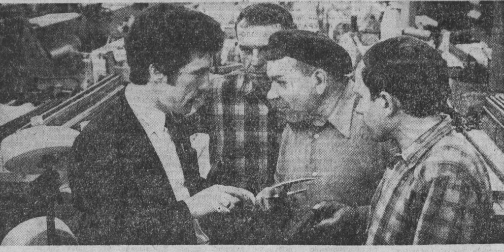
НА КОМБИНАТЕ шелковых тканей вот уже восемь лет активно ведется работа по техническому перевооружению предприятия. Здесь уже установлено 1747 новых современных станков марки СТБ. К концу третьего года двенадцатой пятилетки предполагается полностью заменить все старые оборудование. Большой вклад в техническое перевооружение вносят рационализаторы комбината. Ежегодно на предприятии внедряется свыше ста ценных предложений с экономическим эффектом более двухсот тысяч рублей.

А. ТУЛЕЕВ, заведующий отделом транспорта и связи обкома КПСС.