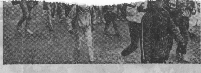
У наших друзей

Эти юные французы вместе со взрослыми приняли участие в антивоенной манифестации, состоявшейся в Париже. «Нам нужен мир, нам нужно будущее» — написано на их плакате.