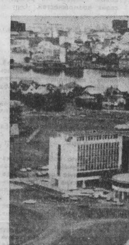
Вид на столицу Исландии — Рейкьявик.

Наиболее важной задачей сейчас является борьба за прекращение ядерных испытаний, отметил он. Это одно из центральных направлений деятельности за оздоровление международной обстановки. В этой связи Й. Енсен дал высокую оценку крупномасштабным переговорам в Женеве.