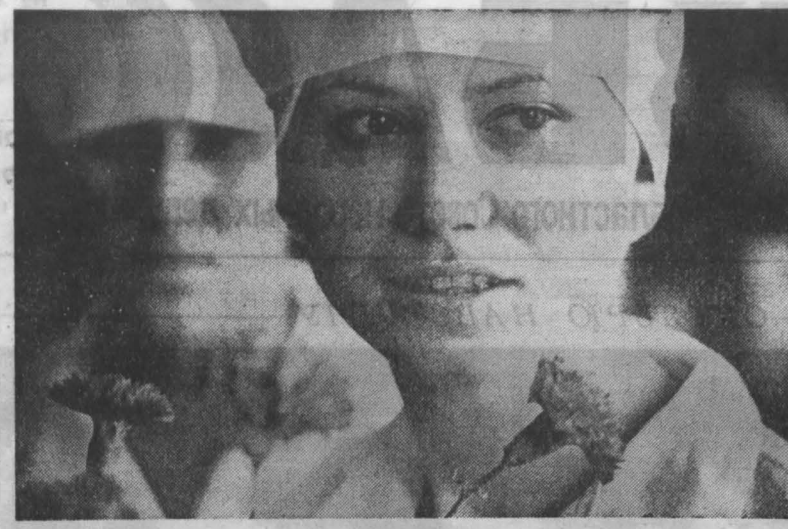
Традиционный конкурс на звание «Лучший по профессии» прошел недавно в залах ресторана «Солнечный». Около 30 человек — повара, кондитеры, официанты из городского треста ресторанов приняли в нем участие. Победители будут состязаться в областном чемпионате, который состоится в конце октября в Новокузнецке.