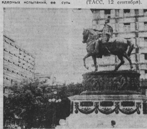
Столица Социалистической Югославии Белград по праву считается одним из красивейших городов Европы...