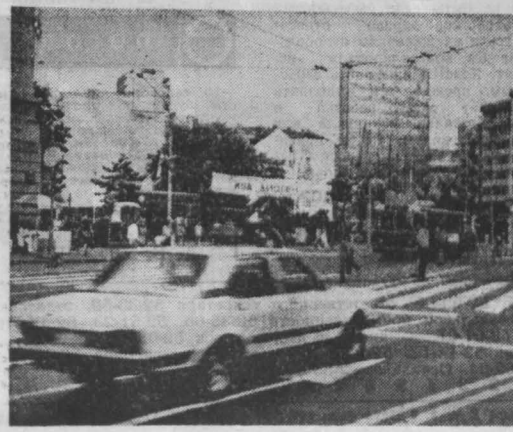
Особая забота градостроителей — старые кварталы благоустроить, реконструировать старые здания...