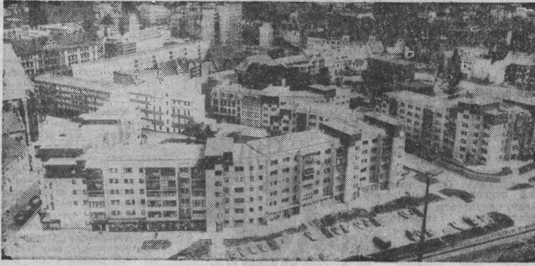
ГР. Вальше тысячи лет стоит на реке Заале город Галле, побратим столицы Советской Башкирии. Ныне это главный город крупного индустриального центра и административного округа восточной части Германии. В нем проживают свыше 230 тысяч человек, среди которых трудящиеся известных промышленных комбинатов «Война» и «Буах». Галле растет и благоустривается. Здесь осуществляется широкая программа нового жилищного строительства, модернизации старых построек. Город, в котором находится старинный университет имени Мартина Лютера, где родился и провел юные годы великий немецкий композитор Георг Фридрих Гендель, всегда гостеприимно принимает многочисленных туристов и любителей музыки, приезжающих на традиционные фестивали. НА СНИМКЕ: панорама города.