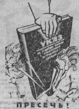
Плакаты художника В. Добровольского.