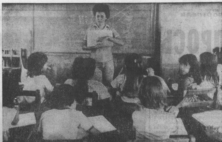
НИКАРАГУА. Диктаторский режим Сомосы оставил тяжелое наследие народному образованию. Более 60 процентов граждан не умеют читать и писать, а в таких департаментах, как Хинотега и Матагальпа, практически все сельское население было неграмотным. Одним из первых шагов победившей Сандинистской революции был декрет о бесплатном образовании. Тысячи добровольцев отправились в деревни и поселки, чтобы дать знания крестьянам и индейцам. Уже через год неграмотность в стране снизилась до 12 процентов, открылись новые школы, техникумы. В текущем учебном году около 900 тысяч молодых никарагуанцев заполнили школьные классы, лаборатории, мастерские. Распахнулись двери школы и колледжи во всех уголках республики, в том числе на севере страны, где сформированные ЦРУ банды недобитых сомосовцев, пытались залучить население, убивая учителей, активистов наемники по ликвидации неграмотности, сжигают школьные помещения. НА СНИМКЕ: на уроке в школе в Мананга.