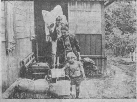
Наш кино клуб