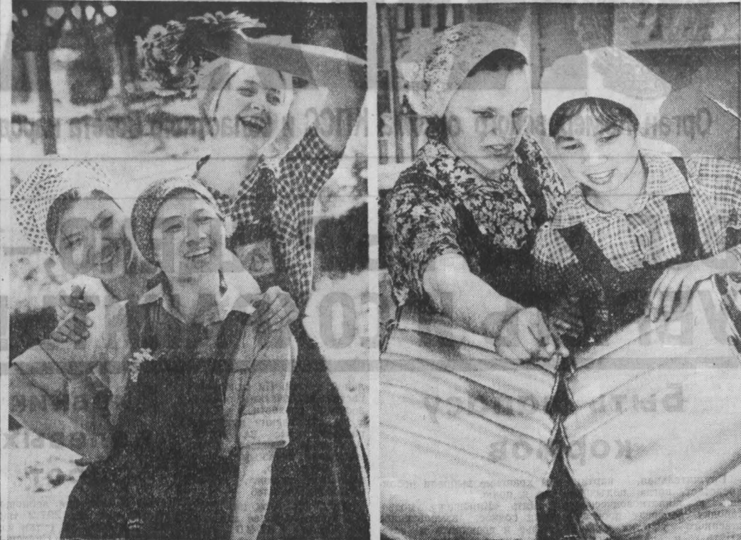
Успешно постигают премудрости профессионального мастера в объединении «Живолоном» молодые работники из Вьетнама. Лучшие наставники предприятия не скучались делиться с двумястами из далекой братской страны своими трудовыми навыками. На родину, во Вьетнам, вернутся классные специалисты — они очень нужны молодой республике.

М. КАМИНСКИЙ, старший инженер лаборатории мембранных процессов НПО «Нарболит», г. Кемерово.