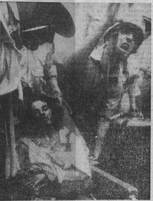
Мощный взрыв недавно потряс ливанскую столицу. Начиненный динамитом автомобиль был взорван на оживленной улице в районе Дора, расположенном в восточной части Бейрута.