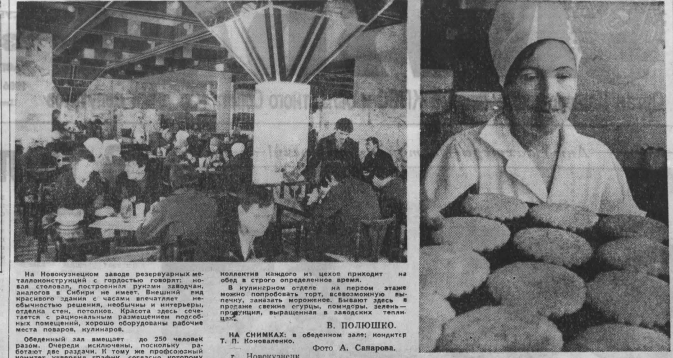
Обеденный зал вымощен до 250 человек. Учредители исключены, поскольку работают две недели. К тому же профсоюзный комитет утвердил график, согласно которому коллегия каждого из цехов приходит на обед в строго определенное время.