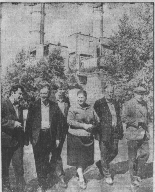
НА СНИМКАХ: члены партгруппы четвертой смены пещера Тонкинского цементного завода.

Д. ШАГНАХМЕТОВ, спец. корр. «Кузбасса», г. Тонки.