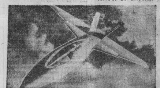
Американский авианосительный конвои «Локхид» приступил к разработке нового истребителя «АТФ» (авант-техникими характеристиками).