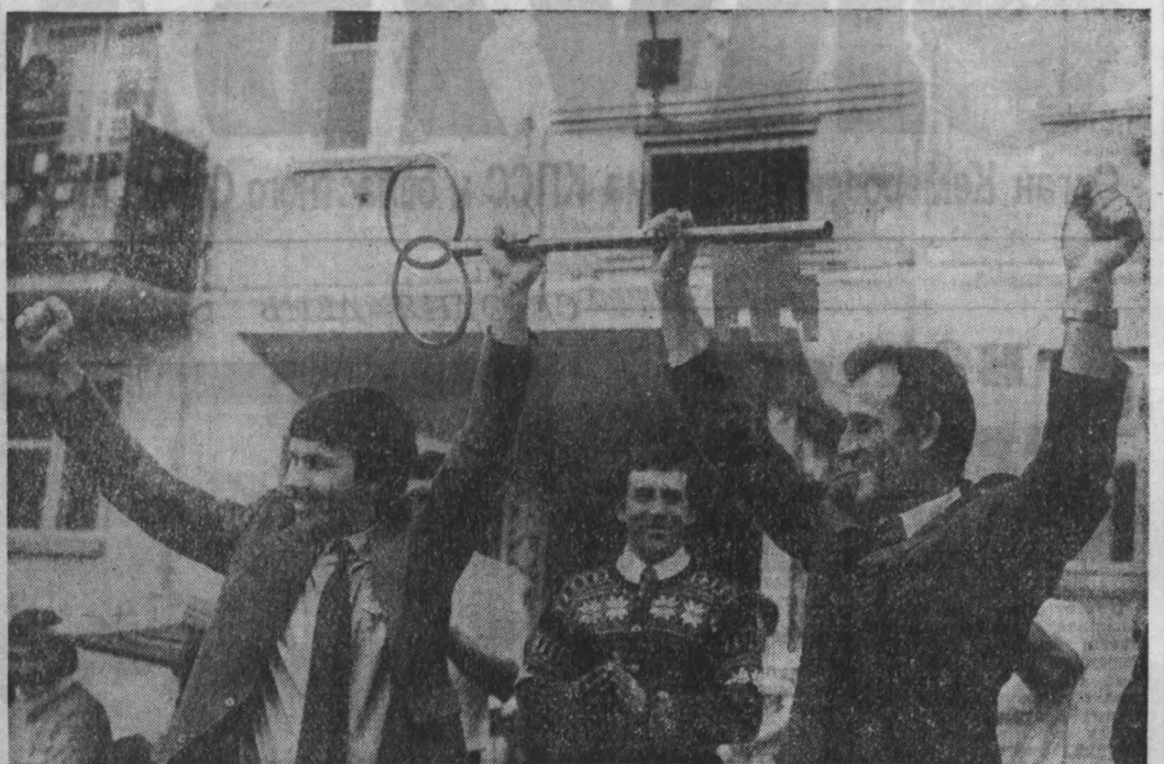
Надолго запомнится бойцам первого комсомольско-молодежного строительного отряда шахты «Распадская» праздники новоселья, который не испортила даже непогода.

«Балконы дома украшены разноцветными шариками, звучит веселая музыка, кругом счастливые лица. Гости от души поздравляют новоселов с праздником. Комиссар отряда рассказывает об ударной работе работников цеха, что знаменует помощь в сооружении дома. Секретарь парткома шахты вручает ему символический ключ. Отныне бойцы отряда и их квартиры будут жить в этом доме, который они построили своими руками. Будут жить рядом друг с другом, словно одна семья».