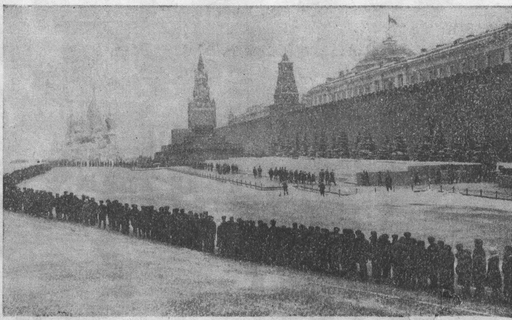
МОСКВА, Красная площадь. К Ленину.