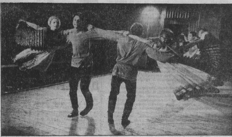
В РИТМАХ ТАНЦА

(выступает ансамбль «Шахтерский огонек»)