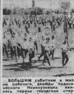
БОЛЬШИМ событием в жизни рабочего, дважды орденоносного Новокузнецкого авиационного завода является первая городская спартакиада. В ней приняли участие многочисленные коллективы металлургов, шахтеров, строителей, учащихся, ветеранов труда и спорта. В течение двух дней на стадионе «Заспичивое», во дворцах спорта, на других спортивных площадках шли упорные соревнования.