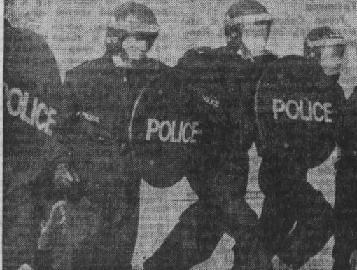
НЕДАВНО улицы британских городов были превращены в полигоны. Англичане «бобби» проводили здесь курс подготовки по контролю над «разбушевавшейся толпой» в действиях «ирландских ситуаций». Полицейские пытались продемонстрировать свое превращение «дугу Хельсинки». С успешным развитием диалога Москва-Париж миролюбивое человечество связывает надежды на возрождение разрядки, на упрочение мира и безопасности.