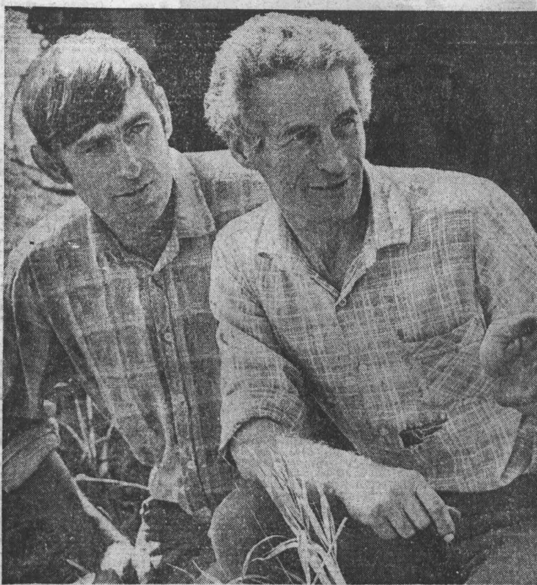
КОЛХОЗ имени Коминтерна приступил к заготовке сена. Здесь организовано два механизированных звена. По плану каждое из них должно убрать по 25 тонн сена за световой рабочий день...