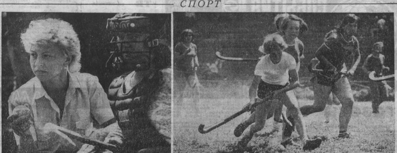
— Хоккей на траве? У нас! — А почему бы и нет? — Пожилейте: ни базы для его развития, ни тренерских кадров, плохо с инвентарем... В общем, несерьезно все это.

Возвращаясь к теме, о которой мы говорили в начале статьи, хотелось бы отметить, что в последние годы в нашей стране наблюдается тенденция к снижению уровня культуры и нравственности населения. Это проявляется в различных формах: от грубости и черствости до преступлений и правонарушений.